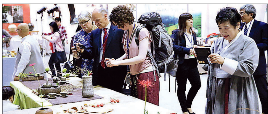
2014년 코엑스에서 열린 명원 세계차박람회 모습

명원문화재단(이사장 김의정)은 10월 29일부터 11월 1일까지 서울 삼성동 코엑스B홀에서 ‘2015 명원 세계 차 박람회’를 개최한다. (사)한국다도총연합회와 (사)홍차협회가 공동 주최하는 이번 행사에는 대한민국과 해외차 산업 100여 개 업체가 참여한다. 하동, 보성, 순천, 장흥 등 국내 주요 전통차들과 유럽·중국·대만·일본 등의 해외 명차가 소개된다.