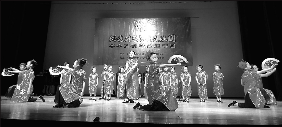
제주 약천사 리틀분다어린이합창단은 10월 16일 중국 북경 숭문소학교를 방문해 '한·중 청소년우호공연'을 펼쳤다. 이날 공연에는 리틀분다어린이합창단원 28명과 중국 숭문소학교 양광합창단원 56명, 어린이 경극팀 등이 함께 했다. 사진 왼쪽은 중국 전통의상을 입고 노래를 부르는 리틀분다어린이합창단, 오른쪽은 중국 숭문소학교의 어린이 경극팀의 공연.