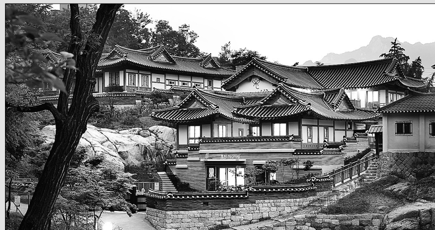
서울 돈암동에 위치한 흥천사(회주 정념) 부설 흥천어린이집이 2015대한민국한옥공모전 '올해의 한옥상'을 거머쥐었다. 사진은 흥천어린이집 전경.

10월 12일 2015대한민국한옥공모전 심사결과 발표 성북구청장, 회주 정념 스님에 감사패 수여