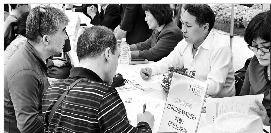
서울 조계사는 10월 22일 대웅전 앞마당에서 '제5회 종로구&조계사 일자리나눔터 채용박람회'를 개최했다.

한편 2013년 10월 처음 시작해 올해로 5회째 맞는 채용박람회에서 누적합계 약 150명, 약 37%가 구직에 성공했다. 총 방문객은 320명에서 시작해 4회차에는 450명에 이르며 꾸준한 반응을 얻고 있다. 박아름 기자