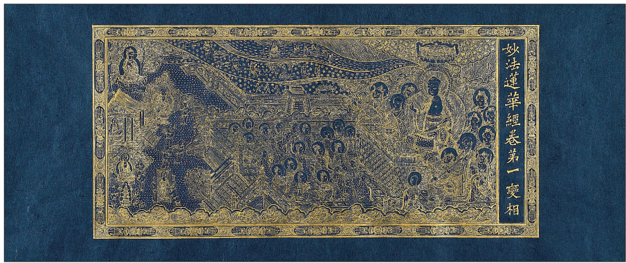
불미전 대상 수상작 '감지금니 묘법연화경 변상도'

대상에는 회화부문 김경미 씨의 '감지금니 묘법연화경 변상도 1~7'을 비롯해 △ 최우수상 조각부문 박경원 씨의 '석조미륵 보살반가사유상', 공예부문 영정 씨의 '운홍사 관음보살도', △ 우수상 회화부문 일오 스님의 '보경사 괘불', 조각부문 김평기