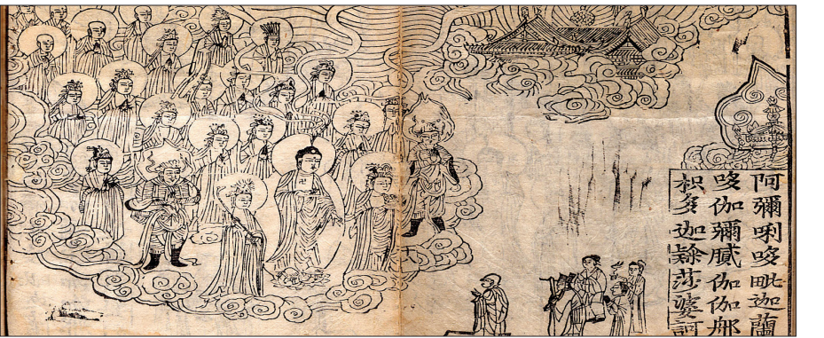
일본 도쿄국립박물관에 출품된 '불설아미타경'

고교부와 문화재단, 일본 문화과학성이 후원하는 이번 전시전에는 한국 고판화박물관 소장 강원도 유형문화재 152호 명주사판 불설아미타경을 비롯해 고려시대까지