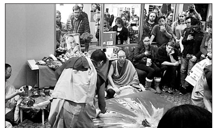
남인도 지역 고망(Gomang)사 출신 티베트 승려들이 미국 드폴(DePaul)대학 링컨파크 캠퍼스에서 만다라를 그리고 있다.

만다라 제작은 인쇄를 요구하고 집착을 버리게 하는 명상과도 같다. 작고 좁은 관을 이용해 색색의 모래알을 뿌리며 일주일 남짓 완성된 만다라는 성 빈센트 드폴 교구의 '반사의 연못'에 뿌려졌다.