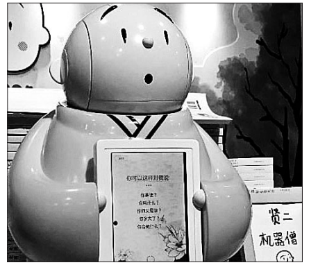
베이징 롱쿠안사(Longquan)가 스님 캐릭터에 IT 기술을 접목한 '로보스님(Robo Monk·사진)'을 제작·배포했다.

여기에 중국의 대표적인 포털사이트 웨이보(Weibo)에 로보스님의 계정을 만들고 블로그 서비스를 제공하는 등 롱쿠안사의 적극적인 노력이 더해져 시공을 초월한 포교에 두드러진 성과를 내고 있다.