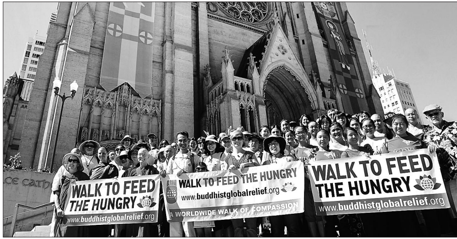
캘리포니아 복지재단 Buddhist Global Relief가 10월 한 달 동안 샌프란시스코, 새너제이, 밀퍼드 일대에서 '기아를 살리기 위한 행보(Walk to Feed the Hungry)'를 개최한다.

2007년으로 거슬러 올라간다. 당시 보디 스님은 미국불교의 성장에 크게 감동하면서도, 실망감도 적지 않았다. 미국 불자들이 추구하는 깨달음이 개인적인 범주에서 벗어나지 못한 데 주목한 것이다.