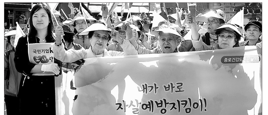
종로노인종합복지관(관장 정관)은 10월 13일 제2회 신노인문화 걷기대회 ‘10월의 어느 가을날 종로를 품다-자살예방 편’을 진행했다.