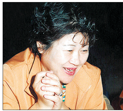
BIFF 위원 시절때 본적 영화감상 100여 편 영화해설과 칼럼 등 묶어

보러 갔다가 감시관 선생님에게 들려 '정학' 위기를 겪었다. 이쯤 되면 김 작가에게도 영화광이란 칭호가 무리는 아닐 듯 하다. 이 소녀 영화광에게겐 슬플때도 한편의 영화는 큰 위트가 되었다. 마치 영화 시나미천국의 토도가 그랬던 것처럼. 대입시험에 낙방했을 때 김 작가는 마리아 메르쿠리와 안소니파킨스 주연의 <죽어도좋아>를 보면서 울었다. 김 작가는 이 당시를 떠올리며 이렇게 말했다. "그런데 영화필름이 몇바퀴 회전한 뒤에는 하늘이 무너져 내릴 것 같은 슬픔이 까맣게 달아나 버렸습니다. 영화관에 들어가기전 압담함과는 또다른 차원의 미래가 어디선가 기다리고 있을 것만 같은 배앓이 생긴 탓일까요?" 김 작가에게 영화는 팍팍한 현실이 주는 긴장감을 풀어주는 해방구이며 소심한 자에게 허용된 무한대의 일탈과 환락의 공간이었다. 그 환상과 기적의 나라에서는 이루지 못할 사랑이 없었고 실현 불가능한 꿈도 없었다. 그 세계에서는 무모한 싸움에 거침없이 뛰어든 영웅이 될 수 있었고, 최악의 나락에서도 불사초처럼 소생하는 대단한 존재가 됐다. 김 작가는 "어차피 인생의 10분의 몇은 이루지 못한, 도전해보지 못했던 것들로 이뤄졌으니 영화세계 안에서 꿈꾸었던 세상을 갖겠 구하해 볼까"라며 "영화에 대한 사랑을 숨기지 않았다." 독서로 비유하자면 김 작가에게 학생시절이 영화에 대한 다독의 시기였다면 앞서 밝힌 것처럼 BIFF 자문위원직을 맡고 난 이후를 본격적인 영화 감상 시기로 나눌 수 있다. 즉 그때부터 김 작가는 영화의 정독을 한 셈이다. 해마다 3백여 편의 세계 각국 작품들이 지구촌 각지에서 몰려오니 20년 동안 김 작가가 감상한 편수를 계산하면 어림잡아 6천 편은 족히 넘을 듯 하다. 슬하에 김 작가의 눈에서 명멸한 그 많은 필름 가운데 뽑혀진 이 책의 영화들을 살펴보니 저자의 취향이 뚜렷이 드러난다. 주인공이 추구하는 진실과 그의 낱말의 행위가 과연 인간의 로서 가치를 지닌 것인가 아닌가 등 인문학적 통찰력을 바탕으로 한 영화가