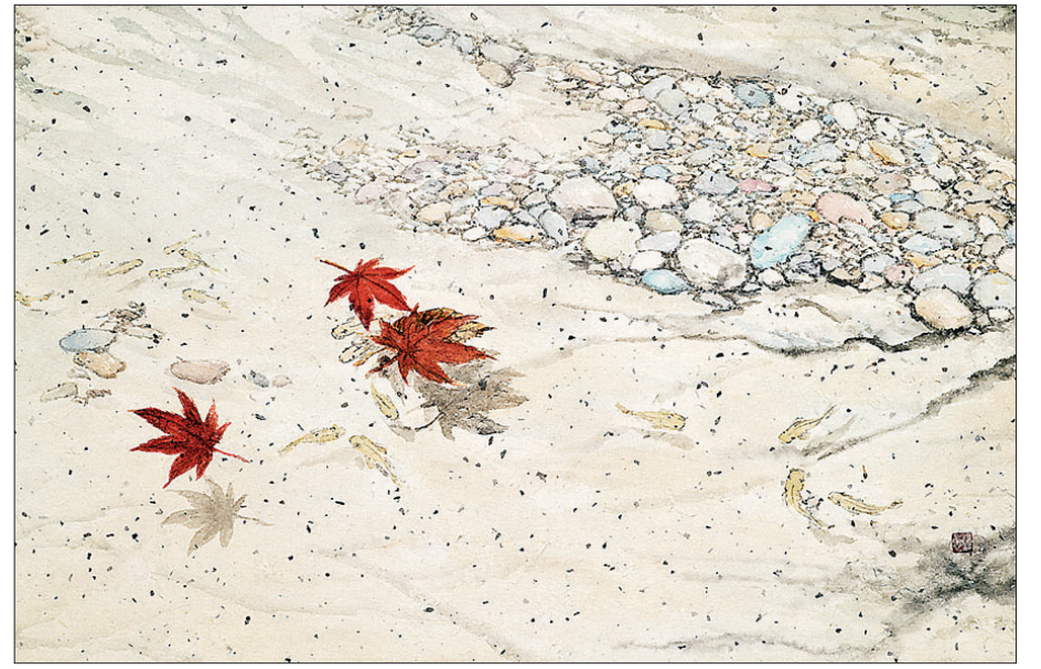
한경혜 작가의 '물고기의 단풍놀이'