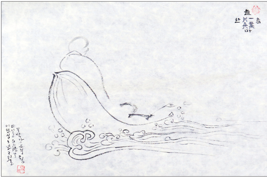
강순형 국립문화재연구소 소장의 '늘 한마음'