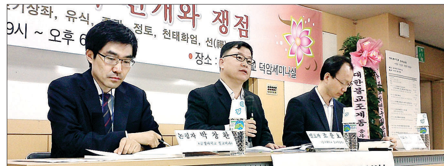
불교학연구회가 2012년 동국대에서 개최한 춘계학술대회 <열반 사상의 전개와 쟁점>에서 학자들이 열린 토론을 하고 있다.

국제불교학회(IABS) : 1976년 창립한 국제불교학회는 구미와 아시아의 주요 불교학자들이 대다수 참여하는 학회로, 세계 불교학계의 중심단체이다. 학술지로는 국제불교학회지(Journal of International Association of Buddhist Studies)를 발간하고 있으며, 3년 마다 학술대회를 열고 있다. 2002년에 방콕, 2005년에 런던, 2008년에 아를란타, 2011년에 타이완, 2014년에 비엔나 등에서 열렸으며, 2017년에는 토론토에서 열릴 예정이다. 학회 본부는 현재 스위스 로잔에 위치해 있다. 학회 본부는 현재 스위스 로잔에 있다. 한국불교학회 : 1973년 창립된 국내 최초 불교학회로 대표적인 불교학계 단체다. 매년 춘·추계 2회의 학술대회와 하·동계 2회 워크숍을 개최하고 있으며 1975년 <한국불교학>을 창간한 이후 매년 3회 발행해 오고 있다. 불교학연구회 : 불교학연구회는 열린 학문 마당을 기치로 토론 중심 학회를 지향하기 위해 2000년 5월 창립됐다. 연 2회 학술대회, 연 2회 논문발표회, 연 2회 워크숍을 개최하고 학술지 <불교학연구>를 연 4회 발간하고 있다. 한국선학회 : 한국선학회는 선학의 기초 이론 정리, 수행방법 고찰 등을 위해 2000년 2월 창립됐다. 춘계와 추계 연 2회 학술대회를 개최하고 있으며 학술지 <한국선학>을 연 3회 발간하고 있다. 인도철학회 : 1988년 창립된 인도철학회는 연 2회 학술발표회를 열고 있으며 학술지 <인도철학>을 발간하고 있다. 회원 중 교수는 30명, 석·박사 과정의 전공자는 60명, 인터넷 회원이 420명에 이르고 있다.