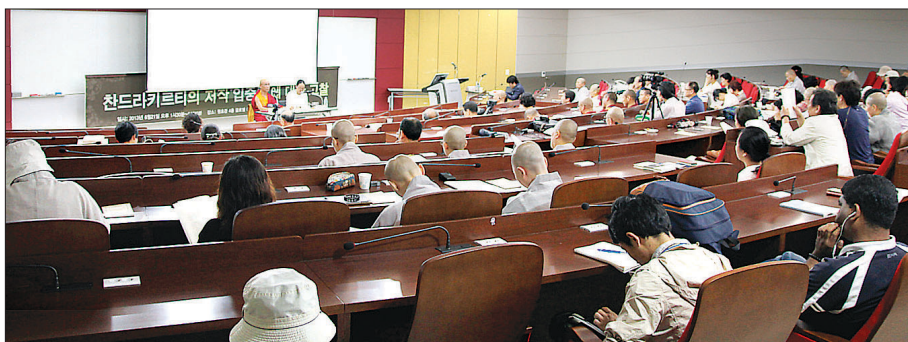
티엔장경연구소가 2013년 8월 동국대 경주캠퍼스 원효관에서 개최한 '2013년 하계 학술 세미나 및 워크숍'의 모습.

근현대 불교학 발전의 뒤에는 여러 연구소들의 역할이 있었다. 동국대 내 불교 문화연구원, 선학연구소, 전자불전연구소와 보조사상연구원, 가산불교문화연구원, 성철선사상연구원 등의 학술회의 및 각종 세미나는 불교학 연구에 활기를 불어넣었다. 동시에 학자들의 모임인 학회의 창립과 활동은 불교학자의 활동반경을 넓혔다. 한국불교학회로부터 인도철학회, 불교학연구회, 한국선학회 등의 활동과 저널 간행은 한국 사회에 불교의 지평을 재인식시키는 기제가 되었다. 이에 창간을 기념해 불교학 연구의 각 기관을 소개한다. 〈편집자주〉