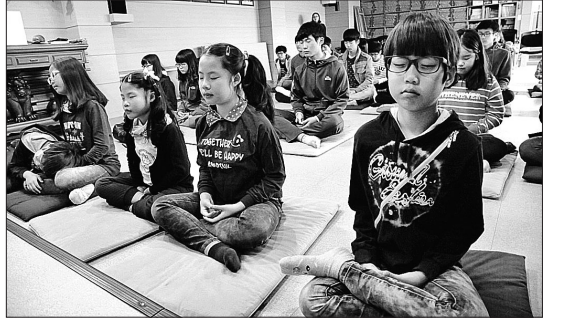
리틀북다에서 참선명상을 하는 어린이들의 모습. 리틀북다에는 중고등학생이 멘토로 참가한다.

늘고 있다. 이는 황룡사 측이 법회 후 진행되는 어린이 명상학교 등을 울산중구자원봉사센터와 연계해 봉사단체로 등록했기 때문이다. 이현미 지도교사는 “학생들은 나이가 많은 선생님들 보다는 젊은 선생님을 선호한다. 중고등학교 언니오빠들과 함께 활동하며 중고등학생들은 봉사활동을 하게 된다”며 “법회 때문에 사찰을 찾는 아이들은 점점 줄고 있다. 학교의 학업과 연계해야 한다”고 말했다. 청소년성취포상제 등이 정해져 있기 때문에 활동하면 여가부 장관상 등을 받다보니 와서 인근 교회에 다니는 학생들도 활동에 참여한다. 형제들이 함께 할