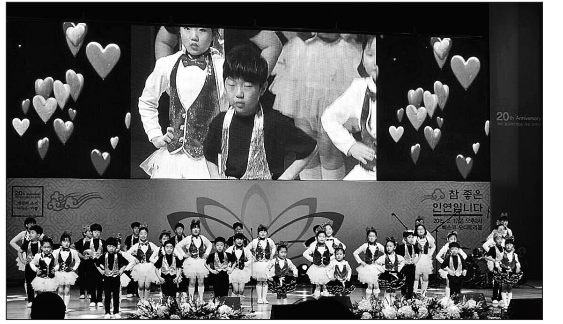
흥법사 어린이 합창단 공연 모습. 합창단 수업은 어린이법회와 특별활동 이후 진행되지만 어머니들의 호응이 높다.

금과 기타 강습이 그것이다. 2부 강습 이후에는 3부로 어린이 합창단 수업이 진행되며 이 수업이 끝나면 3시가 된다. 2부와 3부 수업을 듣기 위해서는 1부인 어린이 법회에 참석해야 하기에 평균 45명 가량의 아이들이 법회에 참석하고 있다. 이 프로그램에는 문화관 총무로 불리는 자모회 어머니들이 아이들 교육을 분담한다. 어린이법회 교사는 4명에 불과하지만 문화관 총무로 불리는 자모회 어머니들이 법회관장팀, 문화팀, 자모봉사팀으로 나눠 유기적으로 활동하고 있다. 이와 함께 각종 강습은 전문지도자를 유급으로 채용하고 있다. 김경숙 청소년교육연구소 소장은 “회비를 받는 대신 출석장학금을 아이들에게 준다. 아이를 보내는 어머니들의 책임감도 높아지는 효과가 있다”고 설명했다. 흥법사에 강습 프로그램이 많은 이유도 어머니들의 요구 때문이다. ‘토요일 아이들 학원에 보낼 것이