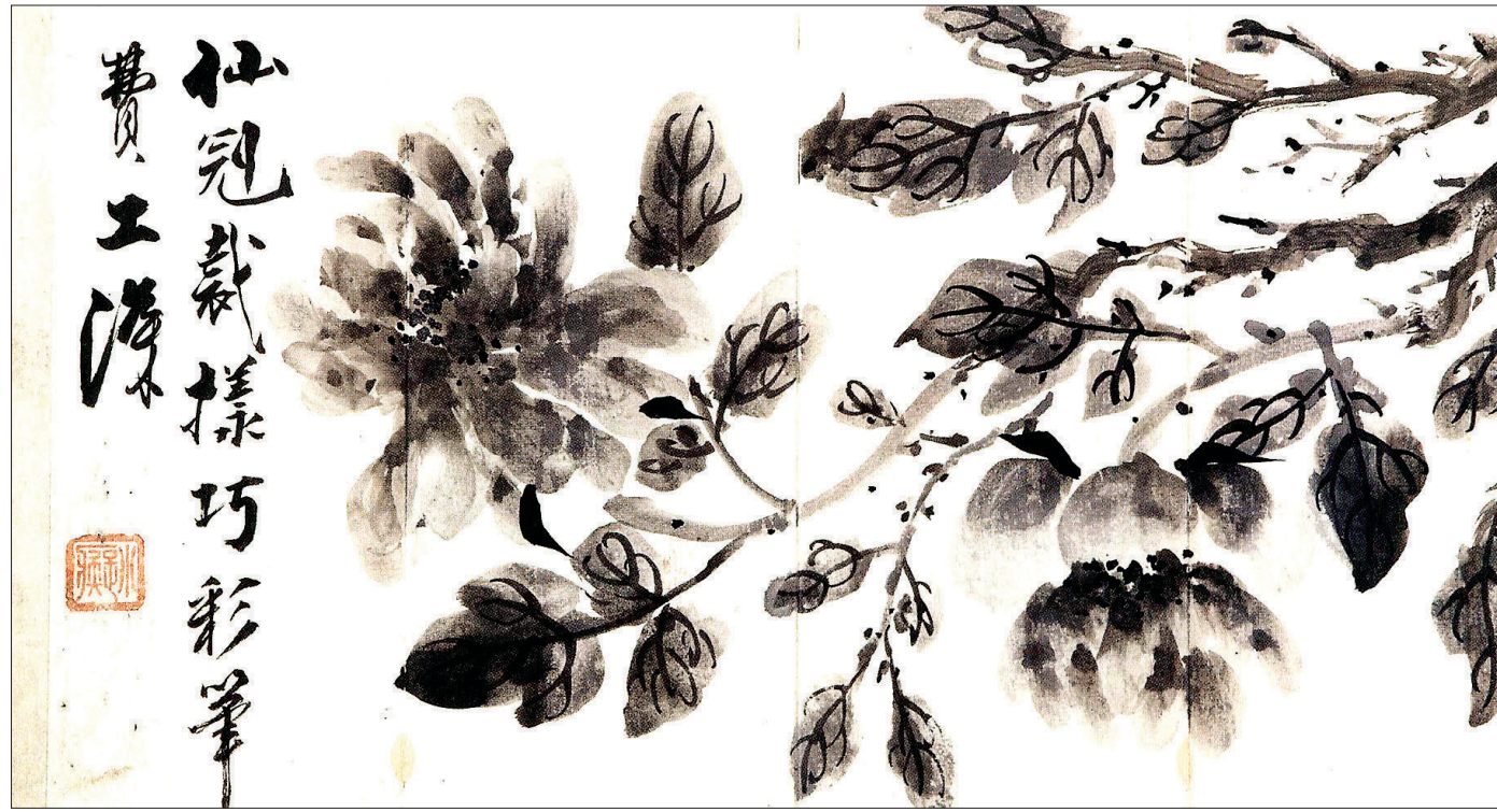
소치 허련의 ‘소치목묘(小癡墨妙)’. 국립중앙박물관에 소장돼 있다. ‘붓을 들어 삼매에 들어갈 수 있으니 이 경지는 소치 한 사람뿐이다’라는 극찬의 이유를 알 수 있다.

불교 禪家에 이어진 초목법 초의 선사가 소치에게 전해 소치 허련, 한산전 머물면서 불화에 열중... 경지 이르러 ‘붓으로 삼매 경지에’ 극찬