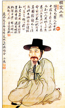
미산의 소치 진영. 소치는 조선 남종화의 대가이면서 불교에도 조예가 깊었다.

불교 禪家에 이어진 초목법 초의 선사가 소치에게 전해 소치 허련, 한산전 머물면서 불화에 열중... 경지 이르러 ‘붓으로 삼매 경지에’ 극찬