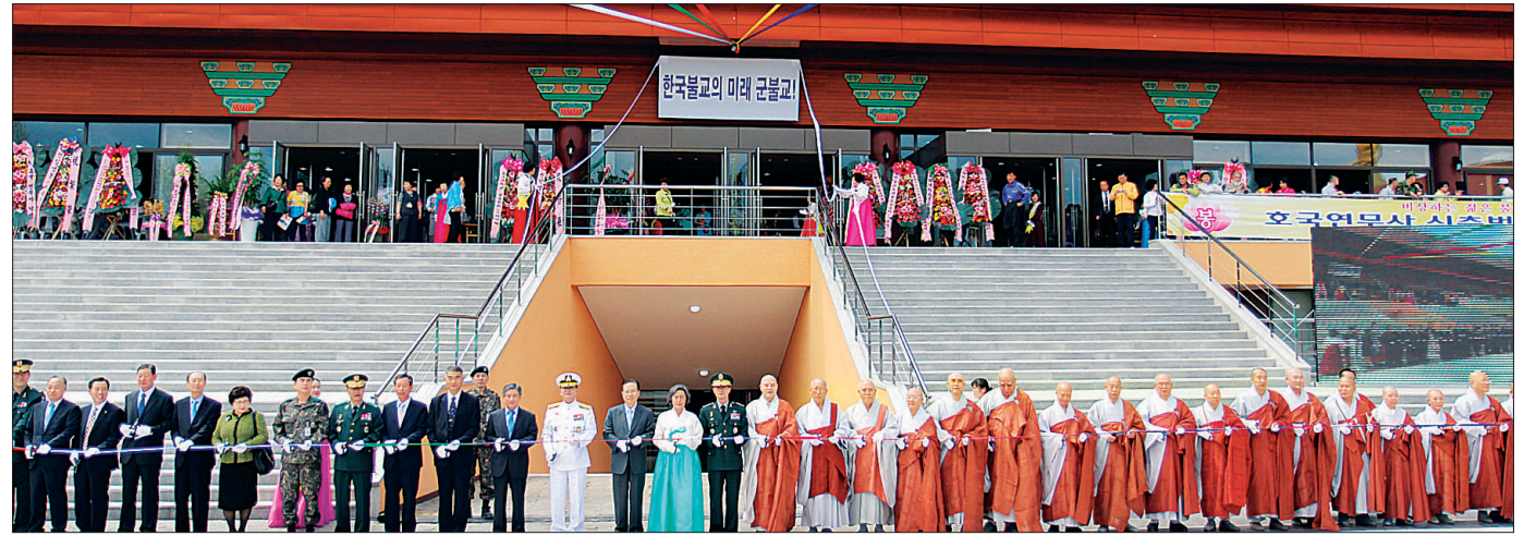
2012년 5월 2일 열린 호국연무사 낙성식. 연면적 5281㎡에 최대 5000명 수용 가능한 대작불사였다.

숙적인 관리에 힘써 2014년 불자생도들이 10%가량 늘어나는 한편, 불자사관제도 유발상조제도에 2015년 상반기에만 12명이 지원했다. 전군 간부불자 통합관리 시스템 또한 구축한 것이 성과로 현재 116곳의 법당 4500여 개 부불자들을 관리하고 있다. 2014년에는 전군 최초로 여성 군종장교로 비구니 스님이 파송되는 등 여러 성과를 냈다. 군속 독신 조향 도입 이후 승려로서의 정체성을 강화해 종단 내 위상을 높이고 있는 점도 성과로 꼽힌다.