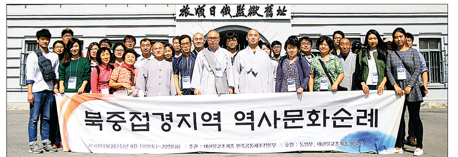
조계종 민족공동체추진본부는 9월 19일~22일 3기 불교지도자과정 일환으로 ‘북중접경지역 역사문화순례’를 개최했다.

순례단은 첫날 여승감옥 및 안중근 의사 추모관을 방문해 독립선열 추모의 시간을 가졌다. 이밖에도 3박 4일간 △2일차- 일보과, 호산장성(백장성), 압록강 단교 △3일차- 백두산 천지, 금강대협곡 △연변박물관 등 일정을 순회했다. 민추본 측은 “순례를 통해 막연하게 여겼던 통일의 중요성과 필요성을 여실히 깨달았다”고 말했다. 박아름 기자