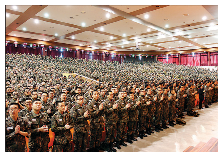
2015년 1월 2일 열린 새해 첫 수계법회