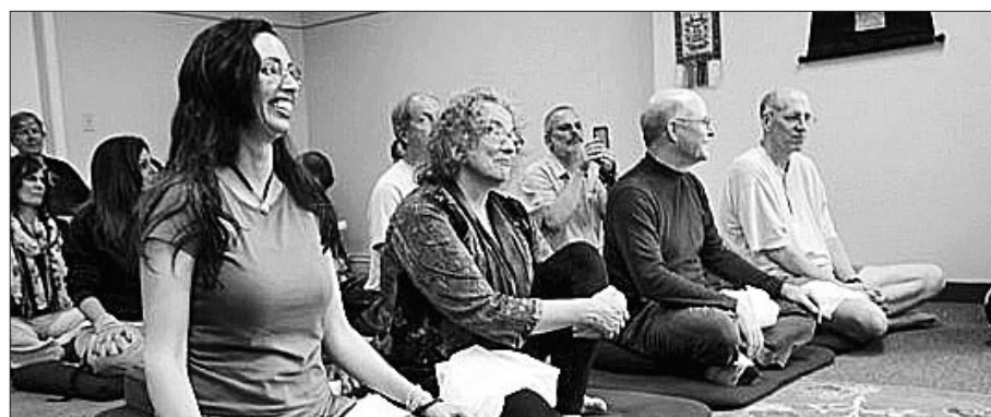
빨첸스터디 회원들이 라마 타쉬 톱가이(Lama Tashi Topgyai) 스님의 가르침을 경청하고 있다.

'시리얼의 도시' 미국 베틀크리크(Battle Creek)에서 불교 명상모임 활동이 활발하다. 'Enquirer'는 9월 20일 "미국 미시간 베틀크리크의 불자모임인 빨첸스터디(Palchen Study)가 매주 토요일 베틀크리크의 공공시설인 '커뮤니티 하우스'에 모여 명상 실습을 진행하는 등 활발한 활동을 이어가고 있다"며 "빨첸스터디는 티베트불교 명상을 배우며 익히고 있는 베틀크리크