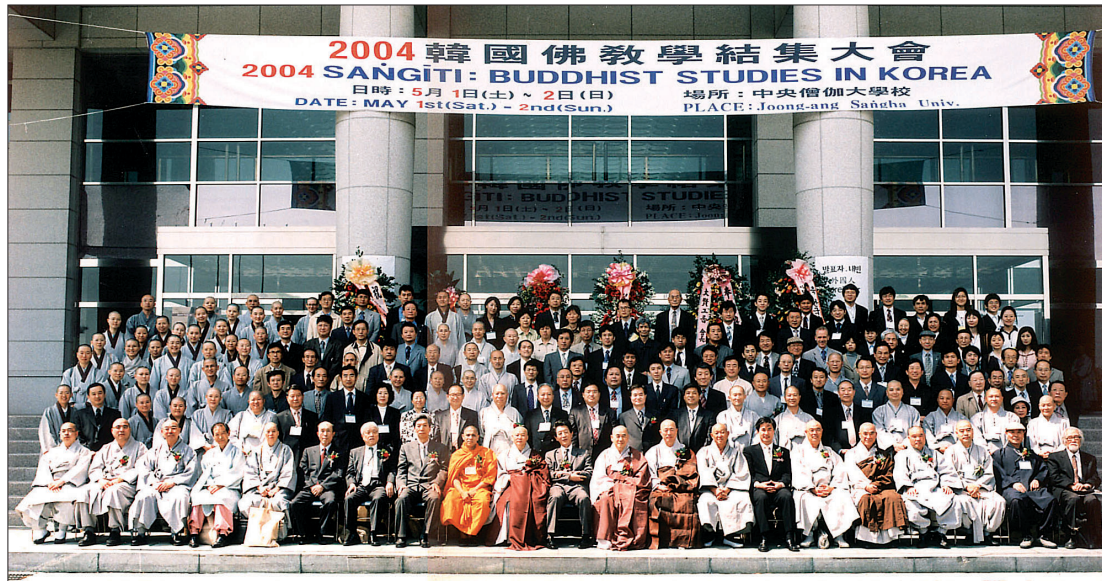
2004년 한국불교학 결집대회. 한국 불교학계는 세계여성불자대회, 한국불교학 결집대회, 세계교수불자대회 등 10여개의 크고 작은 국제학술대회 및 학술간담회를 개최했다. 특히 세계불교학계 석학들의 연이은 방문과 논쟁은 한국불교학이 한 단계 도약하는 계기가 됐다는 평가를 받았다.