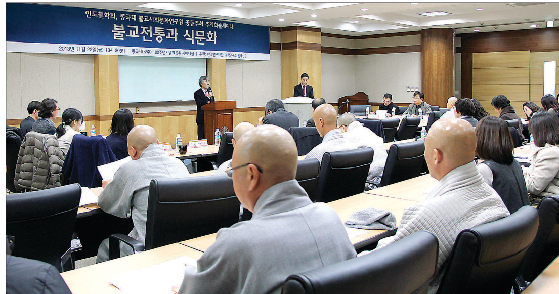
2013년 인도철학회의 '불교전통과 식문화' 세미나. 2000년대 이후 불교학은 기성 불교연구와 함께 다양한 사회문화와의 접점을 모색하는 방향으로 나가고 있다.