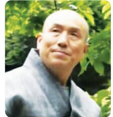
대한불교천부조계종 종정 무불

본 종단은 불기2559년 1월 28일 창종한 종단(宗團)으로 환검단군 대성존(桓檢壇君大聖尊)을 고대불교(古代佛敎)의 교주(敎主)로 석가세존(釋迦世尊)을 근대불교(近代佛敎)의 교주(敎主)로 석가세존으로부터 28대조사(祖師)이고 중국 선종(禪宗)의 조조(初祖)되시는 달마대사(達摩大師)로부터 목조선종(木祖禪宗)을 이어받은 6조 혜능대사(慧能大師)를 종조(宗祖)로 하여 고대불교(古代佛敎)의 교주(敎主)이신 환검단군대성존(桓檢壇君大聖尊)께서 깨치신 진리의 핵심인 일시무시일(一始無始)→ 용변부동본(用變不動本) 일종무종일(一終無終)→ 천부인(天符印)세계의 진리와 근대불교(近代佛敎)의 교주(敎主)이신 석가세존(釋迦世尊)께서 깨치신 핵심진리인 제행무상(諸行無常) 제법무아(諸法無我) 적정열반(寂靜涅槃) 3법인(法印)을 근본교리(根本敎理)로 봉체(奉體)해서 이화세계 불국정토(理化世界 佛國淨土)를 장엄함을 종지(宗旨)로 하여 부모 형제 처자 권속간에 우리 이웃간에 우리 무주간에 이 세상에 아름답게 회향(廻向)하는것을 목적으로 합니다.