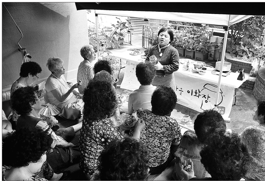
종로노인종합복지관은 이화 경로당 어르신 20여명을 대상으로 장만들기 프로그램인 '이화장'을 실시하고 있다. 참여 어르신들은 마을공동체 기본교육, 이화장 양성교육, 체험활동 등을 통해 전통문화 홍보에도 나설 방침이다.

이화경로당 어르신 20여 명 대상 이화장 양성 교육부터 체험까지 전문성 갖춘 장만들기 교육 실시 10월 23일 '종로 장류 축제' 참여