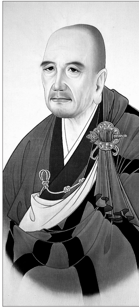
원효 스님의 진영. 1978년 이종상 화백이 그린 것으로 현재 국립현대미술관에 소장돼 있다.

'A 문(門)으로 보면 이런 뜻이 되고 B 문(門)으로 보면 저런 뜻이 된다. 그러므로 모두 살려 통하게 할 수 있다.' 이것이 원효가 구사하는 화쟁 논법의 정형이다. 원효가 시도하는 문(門) 구별은 견해·이론에 대한