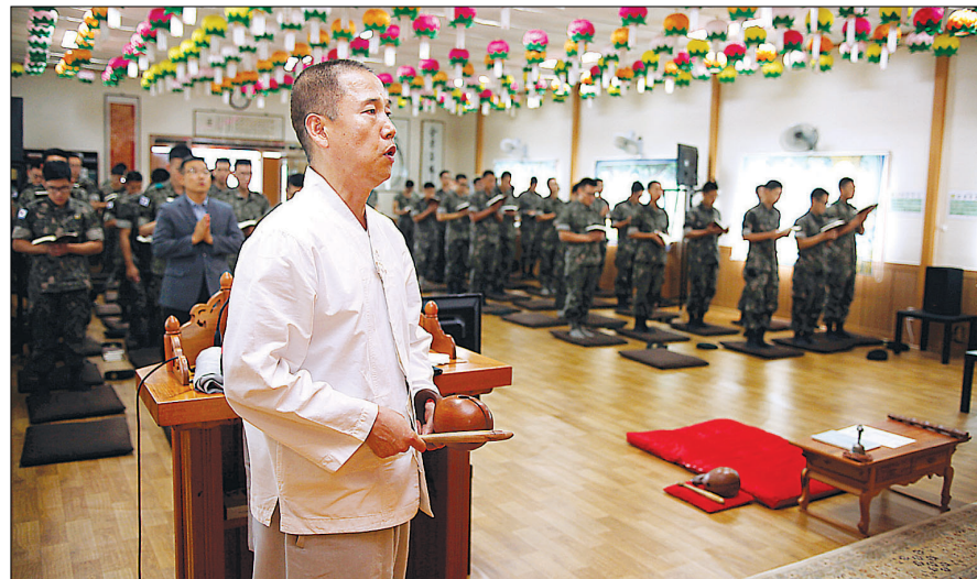
법회에는 60여 장병이 참여했다. 인근 이웃종교 활동의 10배가 넘는 수치다.