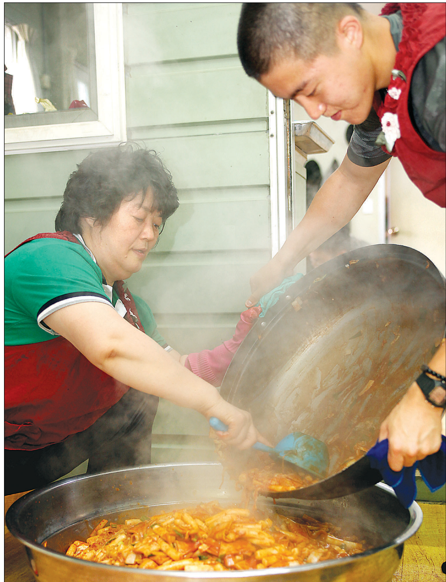
일손을 거드는 군장병과 철마사 보살님이 함께 떡볶이를 만들고 있다.