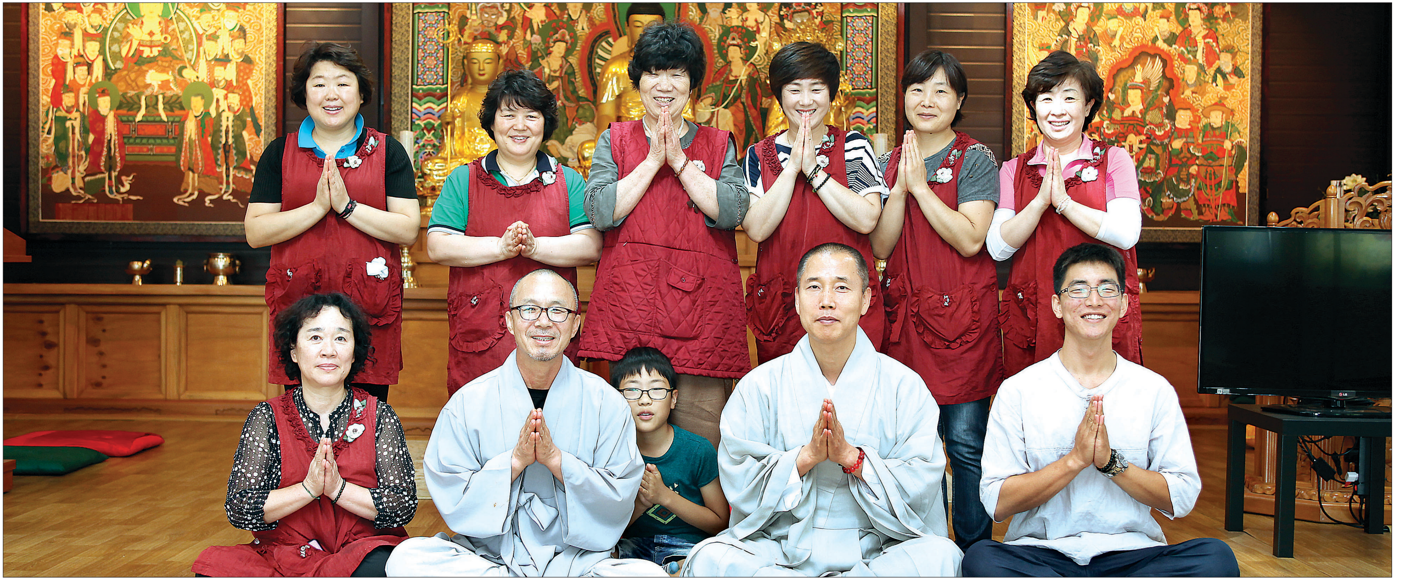
떡볶이 법회로 인연을 맺고 있는 봉사자들이 활짝 웃고 있다. 사단에 적을 둔 봉사자들부터, 지역 사찰 스님, 떡볶이 보시를 위해 먼길을 찾아온 불자들까지 모두 군장병들을 위한 한 마음이었다.

“군인 아저씨! 이 쪽에서 떡볶이를 퍼가도록 해야지... 아이구, 저 아저씨 저렇게 많이 고추장을 넣으면 어떡해?”