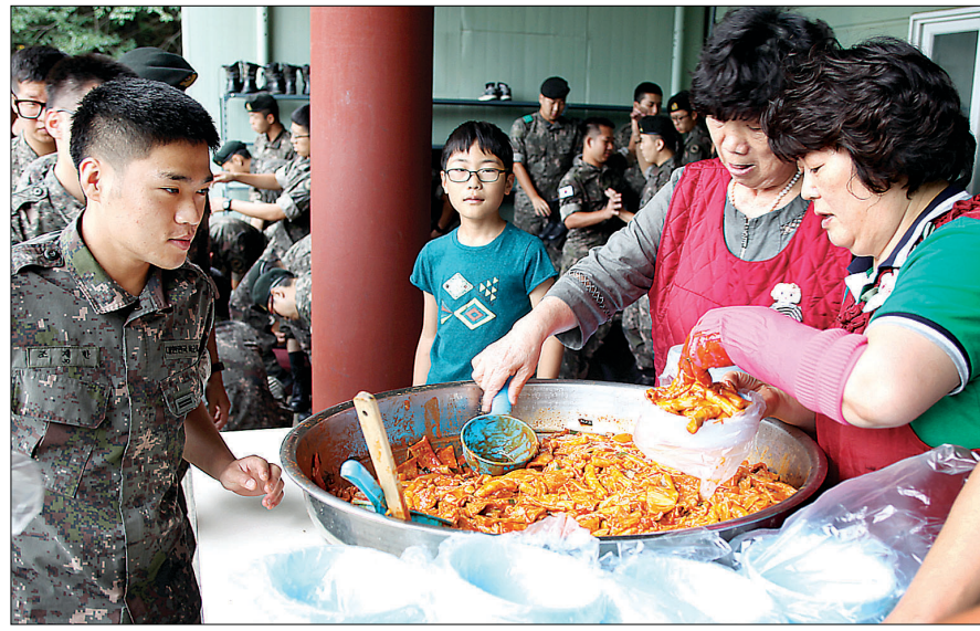
법회 후 철마사 군장병들이 떡볶이를 받아가고 있다.