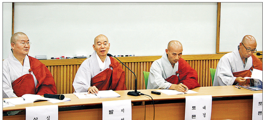
부산불교연합회는 ‘팔계계의 현대적 해석을 통한 사회운동 전개 방안’을 주제로 토론회를 개최했다.

“시대적 요구에 따라 많은 변화를 필요로 하지만 계율을 있어 본질을 지키고 계를 실천 수행하는 것이 곧 사회운동의 답이며 불교 내적 정화에 바탕이 되는 것이다. 불교 수행자가 현재 상황과 형편에 따라 마음을 바꾸고 계를 지키는 것이 타협하는 것은 있어서는 안 될 것이다”