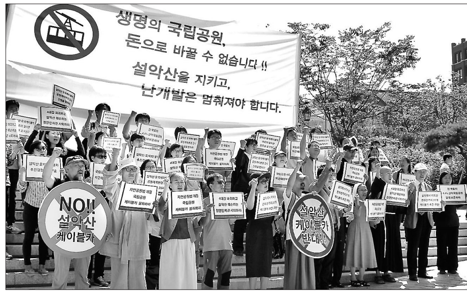
종교계, 환경 및 시민단체로 구성된 설악산케이블카반대국민행동은 9월 10일 서울 명동성당서 국립공원설악산케이블카 저지를 위한 집담회를 개최하고 기자회견을 가졌다.

이에 케이블카반대행동은 설악산케이블카사업계획 폐기를 주장하며 정부에는 올바른 국가환경정책을 세울 것을, 최순실 강