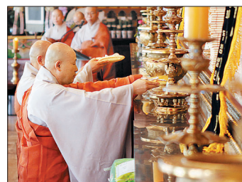
조계종은 9월 8일 서울 종로 조계사 대웅전에서 ‘대비원력의 발심과 실천을 위한 승가청규 고불식’을 개최했다.