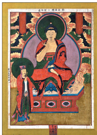
제137회 서울옥션 미술품 경매에 출품된 범어사 칠성도 중 하나. 총 2점이 출품됐다.