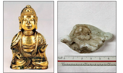
동아대에 소장된 수증사 불상(사진 왼쪽)과 국립부여박물관 수증고에 있는 김시습 사리(사진 오른쪽). 부실관리 및 불법 반출 불교문화재에 환수를 위해 창립한 ‘불교문화재 제자리 찾기 운동’이 이들 문화재 환수 운동을 추진한다.

아래 소장 불상은 연구를 통해 수증사 불상이란 것이 밝혀졌다. 민사조정신청을 통해 해결을 시도하면 적절한 해결책이 나올 것”이라며 “동시에 국립중앙박물관이 소장한 수증사 불상(6점)도 도난품으로 회수된 문화재이므로 반환 운동이 진행되면 자연스