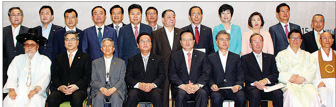
정각희·국회조찬기도회·가톨릭신도의원회·원정회 등 국회종교모임과 ‘답게살겠습니다’ 범국민운동본부는 9월 1일 오전 7시 30분 여의도 국회의원회관 대회의실에서 ‘국회의원 답게살겠습니다 선포식’을 개최했다.

총무위원장 자승 스님을 대독해 축하를 전한 정문 스님은 “국회의원들이 스스로 성찰하며 바르게 살겠다고 다짐하는 것만으로도 큰 의미가 있는 일”이라며 “이를 계기로 국민의 신뢰를 얻을 수 있도록 국회의원들이 ‘답게 살기’를 꾸준히 실천해 나가길 바란다”고 격려했다. 한편 ‘답게살겠습니다’ 운동은 ‘인간답게, 종교인답게, 사회인답게’ 공공에 이바지하겠다는 자기책신 각오를 담아 KCRP가 추진 중인 범국민적 자성운동이다. 박아름 기자