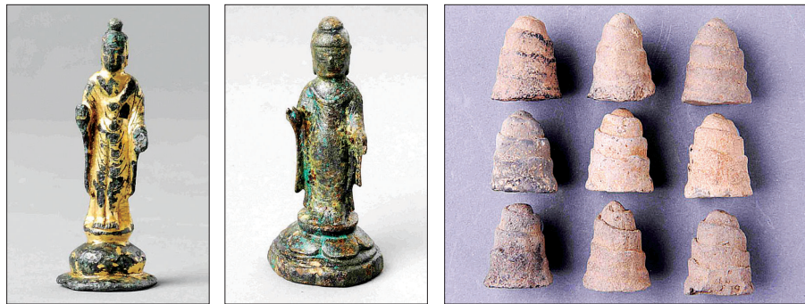
진관사에서 출토된 금동불입상과 토제 나발. 2013년 국가로 귀속됐다 2년만에 불교계로 돌아왔다.

2013년 문화재위원회의 일방적인 결정으로 서울시에 귀속됐던 진관사 출토 유물 280점이 불교계로 돌아왔다. 이 같은 결과는 최근 문화재청 소유권 판정위원회의에서 해당 유물의 역사적 소유권이 사찰에 있다고 결정한 바에 따른 것으로 향후 사찰 출토 문화재 소유권 논란을 종결할 수 있는 중요한 사례로 평가된다.