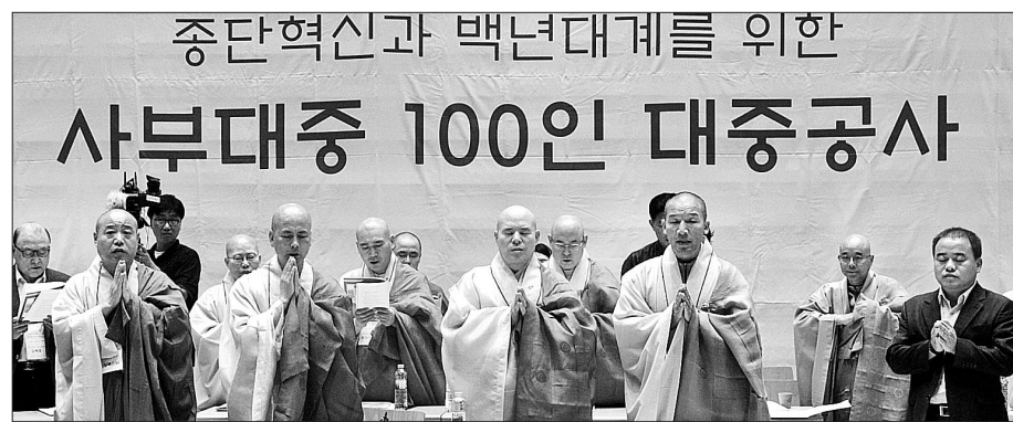
조계종은 8월 26일 공주 태화사 한국문화연수원에서 '사부대중 공동체, 어떻게 이를 것인가'를 주제로 제6차 사부대중 100인 대중공사를 개최했다.

현대적 사부대중 공동체를 구성하기 위해 출가자와 재가자의 신뢰회복이 필요하다는 주장이 제기됐다. 조계종(총무원장 자승)은 8월 26일 공주 태화사 한국문화연수원에서 '사부대중 공동체, 어떻게 이를 것인가'를 주제로 제6차 100인 대중공사를 개최했다. 이날 참가자들은 모두, 분묘 토론들을 거쳐 사부대중 공동체를 구현하기 위해 출·재가의 신뢰 회복이 필요하다고 의견을 모았다. 참가자들은 신뢰 회복 방안으로 사찰운영위원회 강화 등 제도 개선과 의식 교육 등