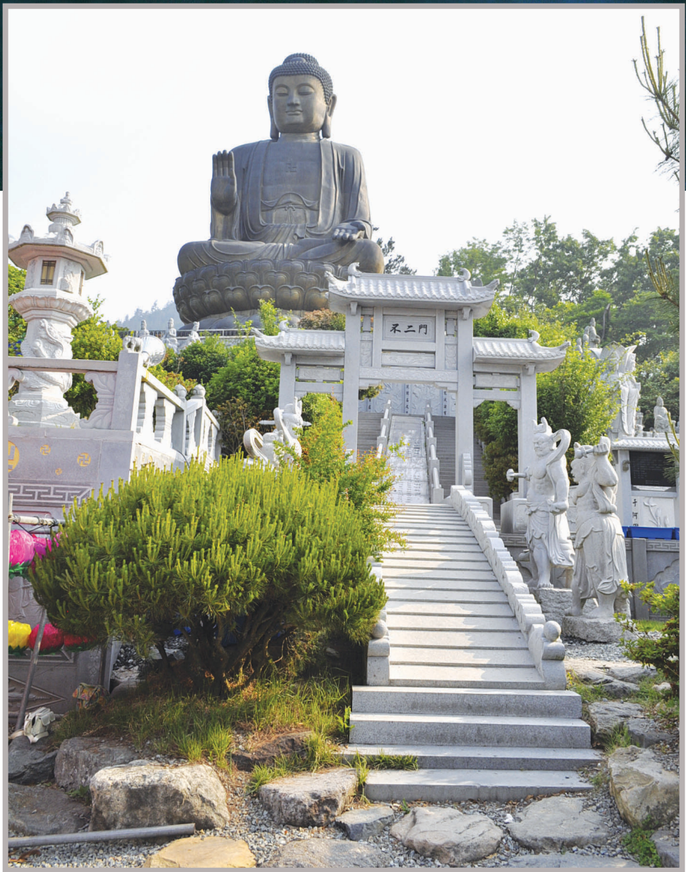
동양 최대 아미타좌불상