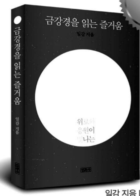
일감 저음 115,000원

‘내비튜 콘서트’로 큰 반향을 불러일으킨 일감 스님이 관계의 미학으로 풀어낸 금강경