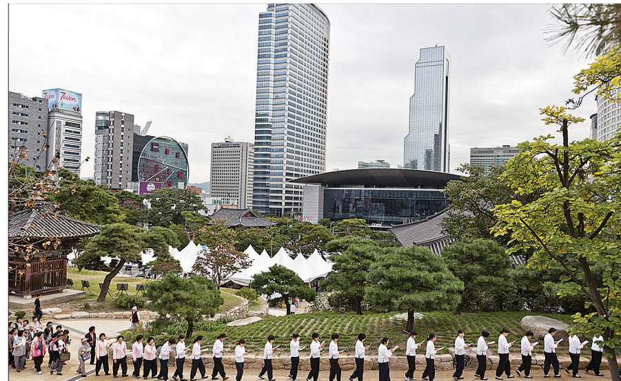
매그넘은 한국의 역사를 카메라에 포착해 전시를 연다. 2013년 봉은사 개산대제 정대불사 장면.

광복 70주년을 맞아 전시 '매그넘 사진의 비밀展-브릴리언트 코리아(Brilliant Korea)'가 10월 3일까지 종로구 세종문화회관 예술동에서 개최된다. 이번 전시에 참여한 9명의 매그넘 포토스(이하, 매그넘)작가는 '한국'을 주제로 대한민국의 전