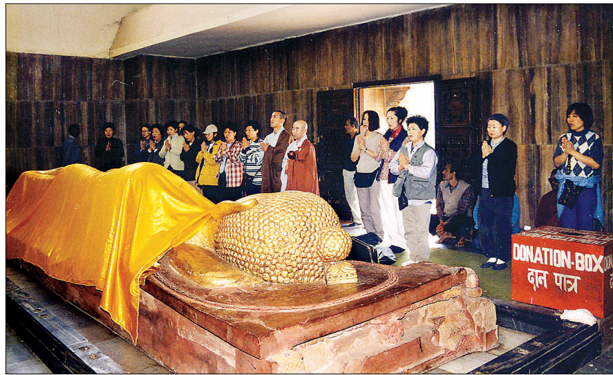
인도 굿시나가르, 이란 원장과 여여원 회원들이 성지순례 중 참배를 하고 있다.