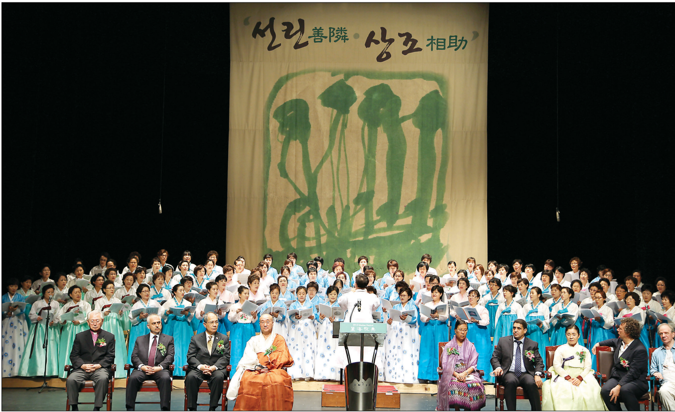
2014년 만해축전의 모습. 불교를 넘어 한국 근대문학의 초석을 다진 만해 한용운 스님은 불교계를 중심으로 다양한 선양사업들이 진행 중에 있다.