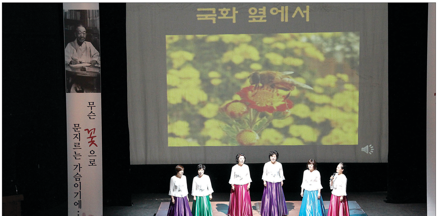
동국대와 사단법인 미당기념사업회는 2월 26일 동국대 이혜령예술극장에서 ‘미당 서정주 탄생 100주년 기념 시낭송 공연’을 개최했다. 동국대 교수를 지내기도 한 미당 서정주는 한국 근대 시문학사에 족적을 크게 남긴 인물이다.

만해 스님 · 이광수 초석 다지고 미당 서정주 · 김동리 기둥 올려 1970~80년대 불교 구도 소설 역사의식 · 보살정신 회통 보여줘