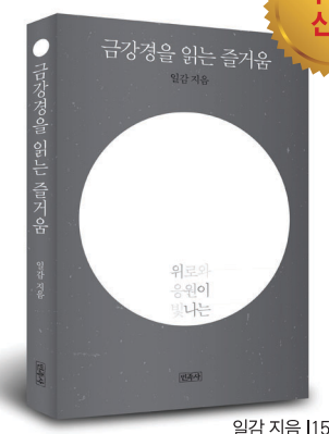
일감 지음 115,000원

‘내비튀 콘서트’로 큰 반향을 불러일으킨 일감 스님이 관계의 미학으로 풀어낸 금강경