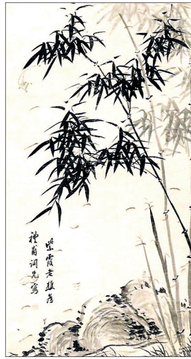
신위는 서화 중 특히 대나무 그림으로 유명했다. 사진은 간송미술관에 있는 '청축'