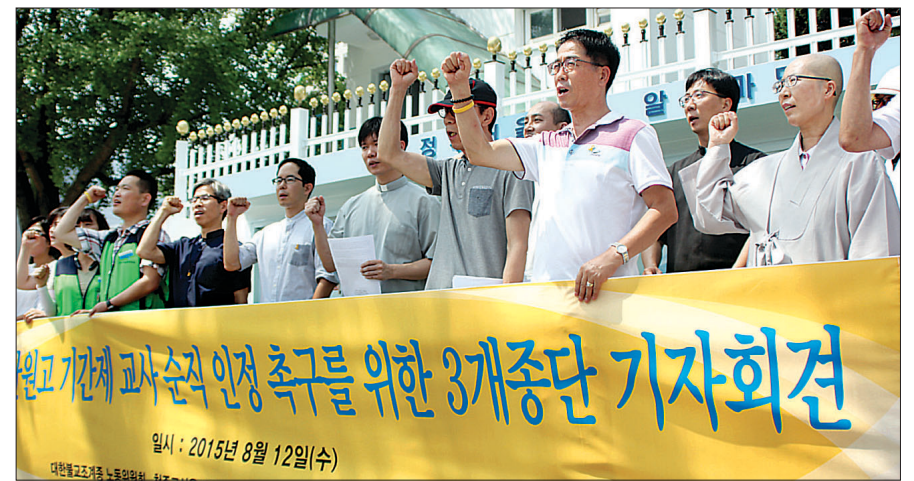
조계종 노동위원회, 한국기독교교회협의회 인권센터, 천주교서울교구 노동사목위원회 등 3대 종교 단체는 8월 12일 서울 세종로 정부종합청사 앞서 ‘세월호 기간제 교사 순직인정을 위한 종교인 호소문’을 발표했다.