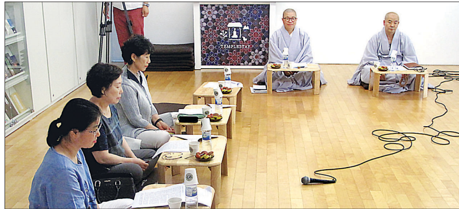
조계종 포교원은 8월 11일 서울 종로 템플스테이통합정보센터 보현실에서 ‘지역공동체 포교 4차 워크숍’을 개최했다. 이날 워크숍에서는 한마음선원과 정토회의 사례 보고와 토의가 이뤄졌다.

“생활을 떠나서 종교는 없다”고 강조한 대행 스님의 가르침에 따라 진행된 한마음선원 문화강좌는 지역민들이 불교를 접하