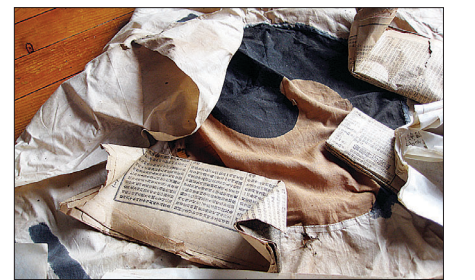
발견 당시 모습. 태극기와 함께 <독립신문> 등 사적류가 나왔다.