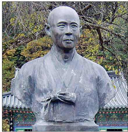
강원 백담사에 세워진 만해 스님 흉상.