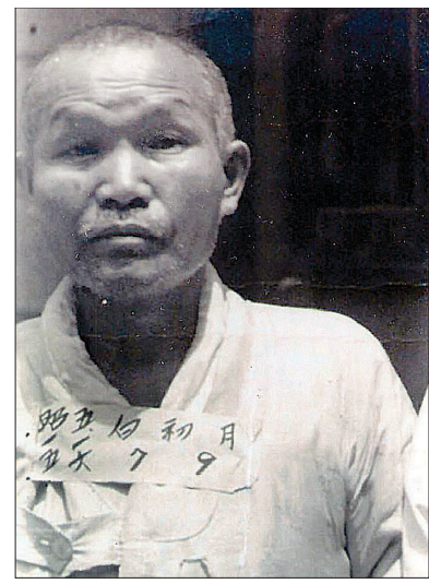
독립운동가 백초월 스님의 생전 모습.

태극기와 <독립신문> 등을 비장(秘藏)한 인물로는 백초월 스님이 지목됐다. 백초