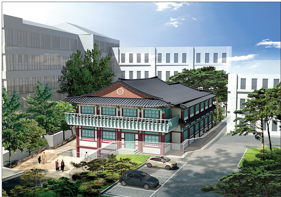
선학원이 중앙선원 자리에 건립불사 중인 한국근대불교문화기념관 조감도. 내년 7월 개관을 목표로 하고 있다.