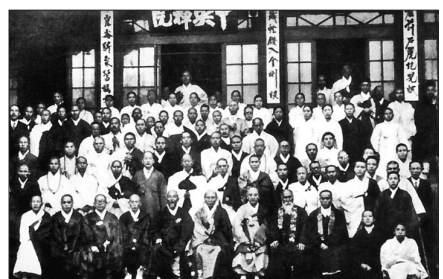
1931년 열린 선학원에서 열린 제1회 전국수좌대회.