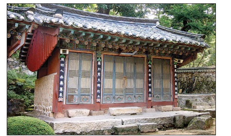
진관사 칠성각. 이곳에서 백초월 스님의 태극기 등이 발견됐다.