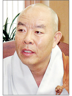
보광 스님 동국대 총장

"현재 한국불교는 역량이 있는 스님들이 전면에 나서기 어려운 구조입니다. 소임을 맞기도 어렵고, 종단의 지원을 받기도 어렵습니다. 그렇기 때문에 일을 하지 않는 것입니다. 좋은 인재들이 전면에 활동할 수 있는 내부 풍토를 만들어주는 것이 필요합니다. 이런 내부 풍토가 완성돼야 포교도 인재 출가도 이뤄질 수 있습니다."