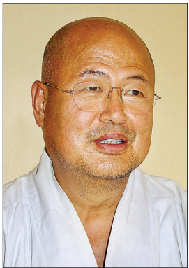
원경 스님 조계종 원로의원

불교 각종 행정·제도 훌륭히 안착 지도자 스님 그룹은 예전보다 퇴보 양적 발전보다 질적 발전 꾀할 때