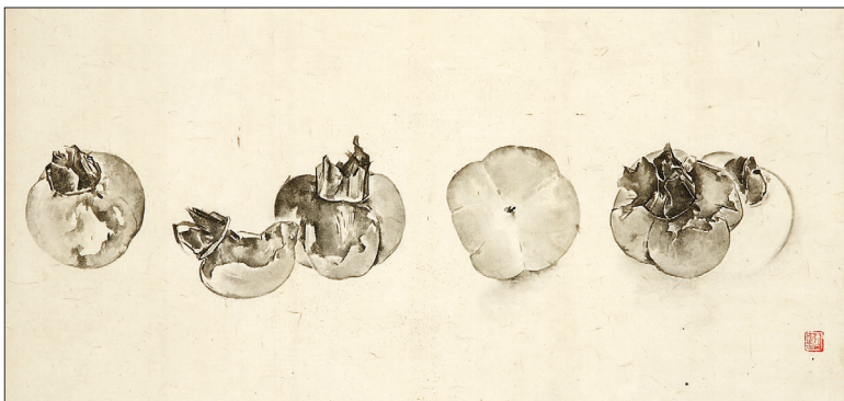
임추기(부분), 88x59cm, 종이에 수묵, 2013. 하늘길(까치밥)은 새들과 공유한다. 그이는 세상의 잣대가 아니라 자연의 본성에 충성한 삶을 살았다. 오직 한 물건을 향한 스님의 참모습과 방불하다.