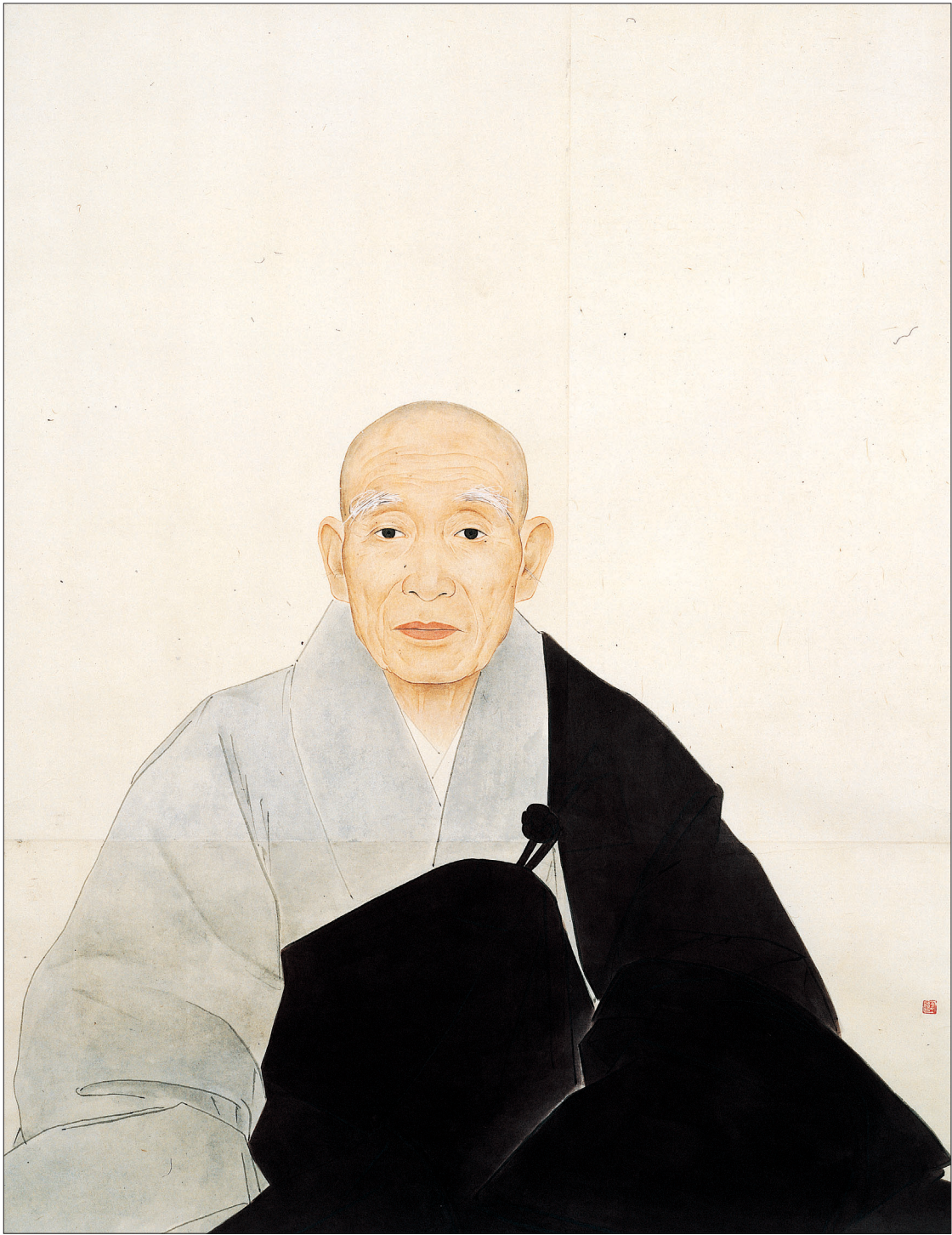
스님의 눈빛은 깊은 명상에 잠긴 듯 고요하다. 그 모습은 눈이 외부로 향해 열려 있다기보다 내부를 향하여 자신을 보고 있는 심득의 경지이다.