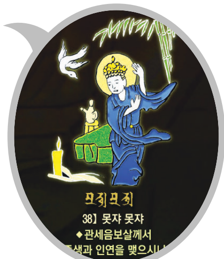
신묘장구 대다라니 족자 중의 '못자못자' 확대사진

범보시용으로 탁월하며 각 가정에 행운과 복을 선사합니다. 10개 이상 구매시 원하시는 문구를 새겨 드립니다.