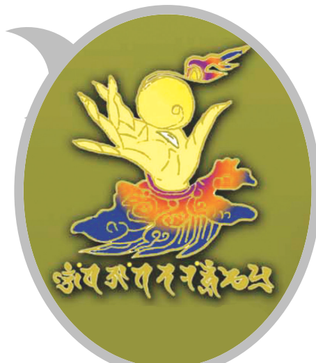
42수진언 족자 중의 '여의수주 진언' 확대사진