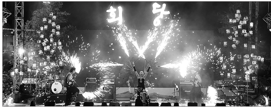
진각종은 7월 27일부터 30일까지 울릉도에서 2015 회당문화축제를 개최했다. 2001년부터 시작된 회당문화축제는 울릉도 지역 최대 문화축제로 자리를 잡았다.

울릉지역 최대 문화축제로 자리를 잡은 회당문화축제가 7월 27일부터 30일까지 진각종 창주주 회당대중사 탄생지 울릉도에서 개최됐다. 진각종은 광복 70주년, 국민통합과 나라 안녕의 서원을 담아 ‘비나리 독도아리랑’이란 주제로 ‘2015 회당문화축제’를 개최했다. 체험·전시마당과 공연마당으로 나눠 진행된 축제는 울릉도 주민들과 관광객들에게 풍성한 볼거리와 즐길 거리를 제공했다. 첫 무대는 동덕여자대학교 실용음악과 학생들이 ‘미인’, ‘누구없소’, ‘봄비’, ‘고래사냥’ 등 대중들에게 친숙한 음악을 선