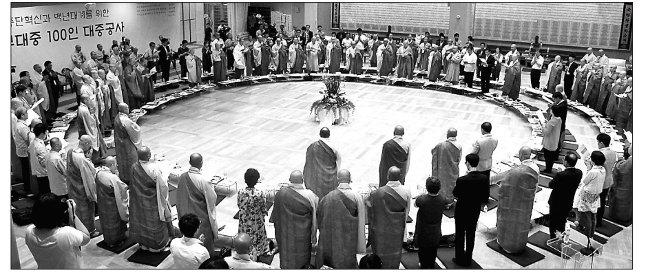
조계종은 7월 29일 서울 불광사에서 ‘종단 개혁과 서의현 前 총무원장 재심 결정’을 의제로 열린 5차 사부대중 100인 대중공사를 진행했다. 이날 참가자들은 8시간의 논의 끝에 의현 스님 재심 결정이 “개혁정신과 대중공의에 어긋난 잘못된 판결”이라는 결론을 냈다.

체가 참여하고 있는 94년 불교개혁정신을 실천하기 위한 비상대책회의는 7월 30일 발표한 논평을 통해 “재심호계원의 잘못된 결정에 대한 참여자 전체의 통일된 입장이 전체 중도 대중의 여론과 다르지 않게 결론을 도출한 점은 성과”라면서도 “대중공의 기구 구성은 구성할 주체도 방향도 없는 100인 대중공사의 태생적 한계를 그대로 노정시킨 무의미한 결의”라고 지적했다.