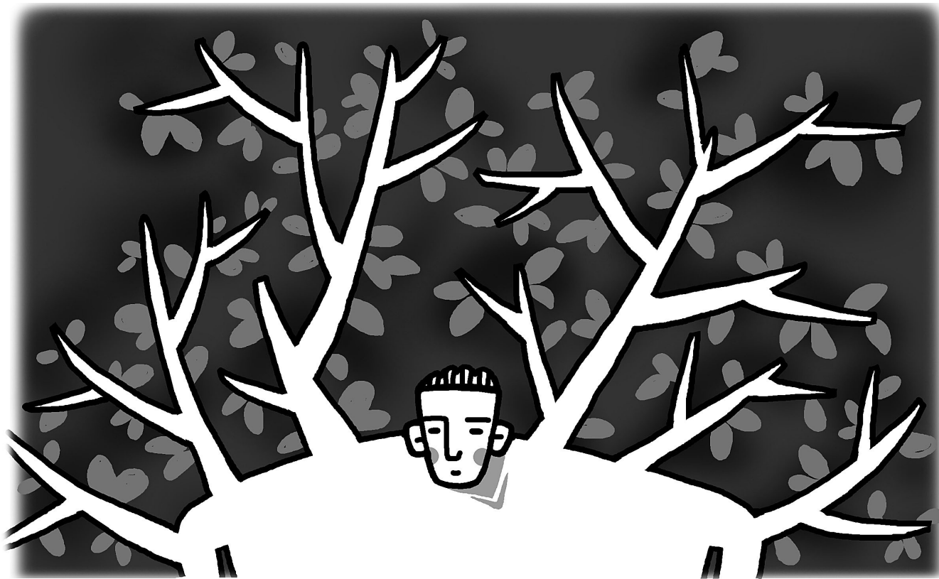
그림 · 최주현

그래서 도를 이루어도, 즉 견성은 했어도 금방 태어난 아기와 같다고 하는 겁니다. 돌 아닌 도리를 알기 위해서 숨을 녹여야 하기 때문에 또 죽어야 한다고 했습니다. 알기만 하면 또 뭘 할니까? 그것도 도가 아니라 그랬습니다. 남이 목마를 때 떠 줄 수 있고 내가 먹을 수 있어야만 이 된다고 했습니다. 돌 아닌 도리를 알았으면 돌 아니게 나를 잘 알아야 한다는 얘깁니다. 그러니 얼마만큼 똑바로 들어가야만 되겠습니까?