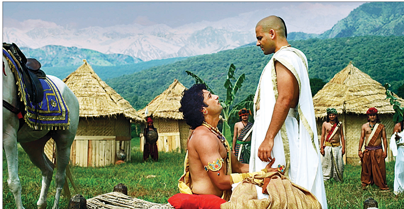
스승은 왕궁을 떠나며 신타르타에게 분노, 증오, 마음의 끌림, 미혹, 갈애 등에 얽매게 될 때, 그제서야 그것들을 놓아버리는 방법도 알게 될 거라고 이야기 한다.