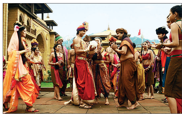
신타르타는 치타에게 물린 아기를 구해낸다.