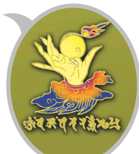
42수진언 족자 중의 '여의수주 진언' 확대사진