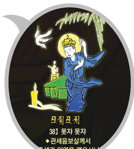
신묘장구 대다라니 족자 중의 '못자못자' 확대사진

판매처 : 현불샵 ☎ 02)2004-8216 농협 053-01-269062(주식회사)현대불교신문사