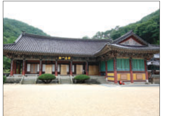
1959년에 낙성된 선원인 '선해일륜(禪海一輪)'.

징으로 떠오른 이유는 정작 아름다운 풍광 때문이 아니다. 내원사 산감으로 천성산 지킴이를 자처한 지을 스님의 기나긴 단식투쟁 때문이었다. 천성산을 관통하는 KTX 터널 공사에 반대하며 2003년 3월부터 스님은 고행을 시작했다.