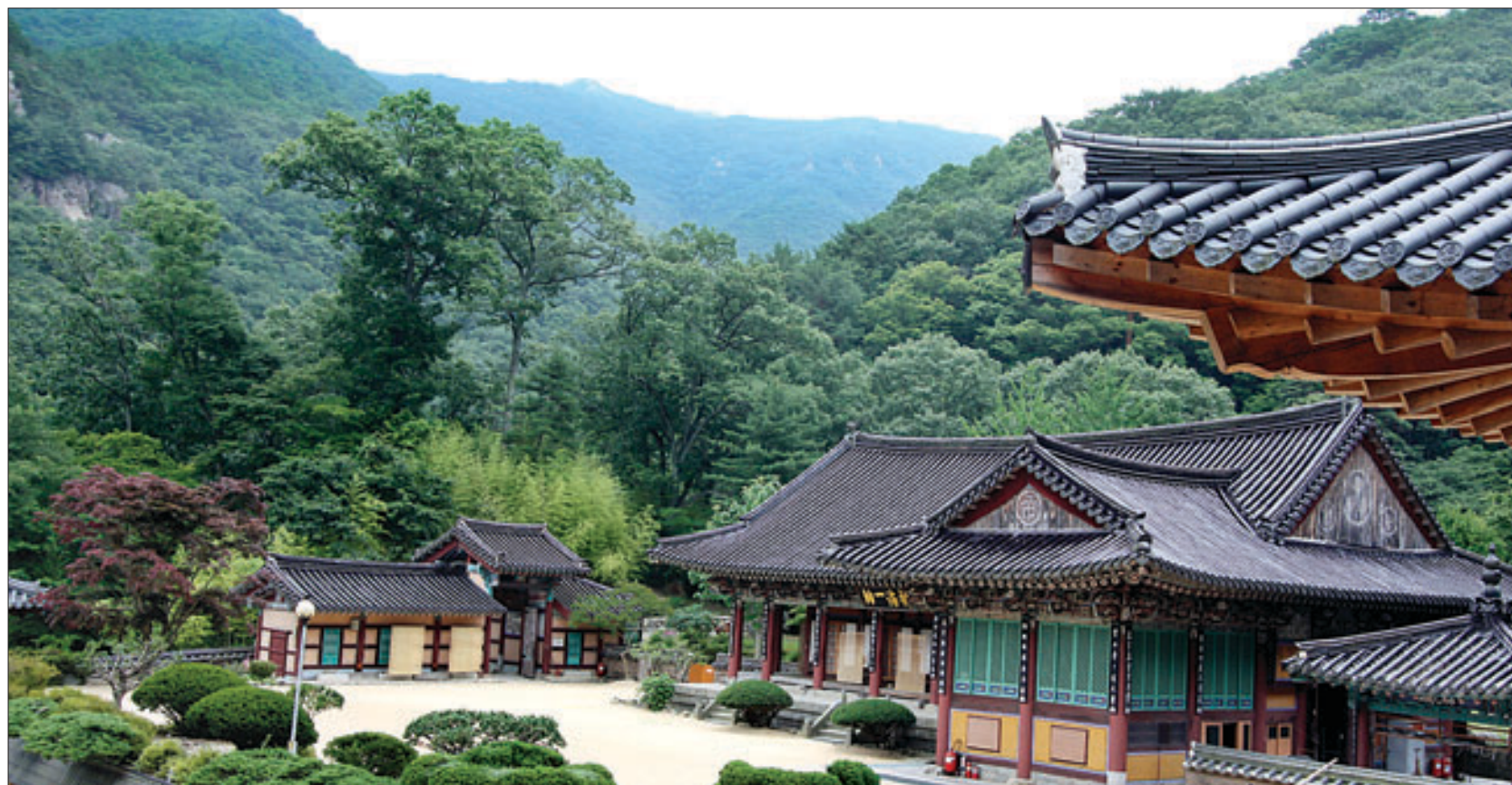
천성산 기슭에 위치한 내원사는 신라 선덕여왕 15년 원효대사가 창건한 비구니 명찰이다. 사진은 내원사 사찰 전경 모습.

기나긴 세월의 풍화작용속에 대둔사, 상종의 내원암과 89개의 암자는 조선종염종 이미 거의 다 폐허