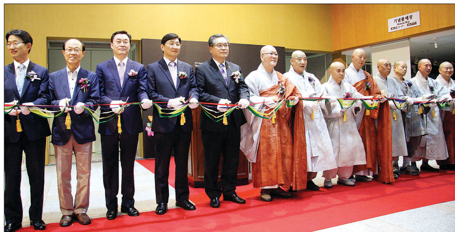
금정총림 범어사와 부산박물관이 주최하는 특별기획전 ‘천년고찰 범어사’ 개막식을 7월 20일 부산박물관 기획전시실에서 개최했다. 사진은 테이프 커팅식

특히, 성보박물관 소장 <삼국유사> 권 4~5(보물 제419~3호), <불조삼경>(보물 제1224~2호), <주범명경>(보물 제894~2호), <금장요집경> 권1~2(보물 제1525호)를 비롯해 부산 국청사 동북(보물 제1733