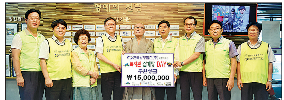
(주)한국남부발전은 복날을 맞아 7월 13일 용호복지관 어르신들 500여 명에게 삼계탕을 대접하고 후원금을 전달했다.

앞으로 용호종합복지관은 다가오는 말복 8월 12일에도 사랑의 삼계탕 DAY를 개최해 어르신들을 위한 나눔을 실천할 예정이다. 하성미 기자