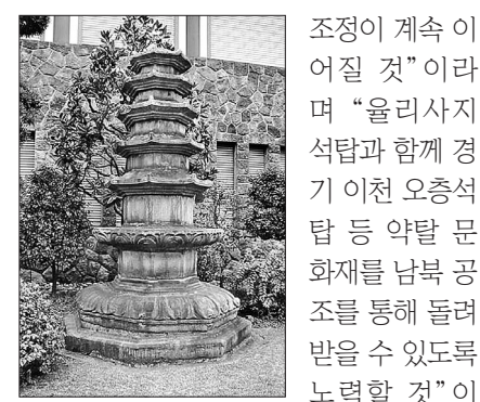
조정기 계속 이어질 것”이라며 “올리사지 석탑과 함께 경기 이전 오층석탑 등 약탈 문화재를 남북 공조를 통해 돌려받을 수 있도록 노력할 것”이라고 말했다.