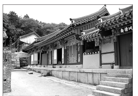
범어사 비로전과 미륵전

의 원편에 비로전과 함께 나란히 자리 잡고 있다. 정면 3칸, 측면 2칸 규모의 익공식(翼工式) 맞배지붕 부불전(副佛殿)이다.