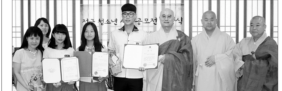
파라미타청소년연합회는 7월 20일 제18회 전국청소년 사경공모전 시상식을 거행했다.

지원 스님은 "요즘 인성을 강조하는 시대에 수상한 모든 작품에도 학생들의 인성이 녹아있는 것 같다"면서 "불자 된 도리로서 부처님 법을 널리 펼치는 인재가 되길 바란다"고 축하를 전했다. 박아름 기자