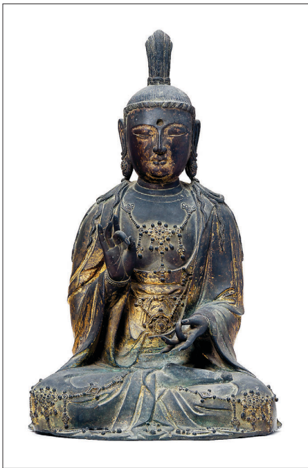
삼성미술관 리움의 '세밀가귀-한국미술의 품격' 전시 9월 13일까지 리움 미술관에서 열린다. 사진 왼쪽은 금동대세지보살 좌상, 오른쪽은 백제 금동 대향로.

금속공예품을 비롯해 화려한 아름다움을 보여주는 삼각형자 등의 장식은 물론, '천하제일'이라 칭송 받던 비석과 그 안에 숨겨진 문양을 보여주는 비석청자 등 시대를 대표하는 유물들을 통해 공예 작품에 나타나는 정교함과 화려함의 원류를 살펴본다.