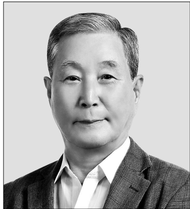
불교계 유일의 산림연구기관 국립산림과학원 경력 도대 생태조사 및 임업 계획 수립

이 소장은 “계획적으로 일부 나무를 베어서 이용하고 그 자리에 새로운 나무를 심는다면 벌채한 나무를 매각해서 얻을 수 있는 경제적 이익과 가치도 매우 높을 것”이라며 “이는 불교계 재정 확보에도 매우 큰 도움이 될 것”이라고 말했다. 또 이 소장은 “후대를 위한 생태보전의 경제적 가치는 계산할 수 없다. 계획적인 벌목과 관리 등을 지