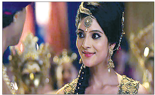
십년만에 시타르타 왕자를 다시 만난 야소다라의 모습

한 남자가 궁 안으로 무단 침입하는 사건이 발생한다. 그는 왕이 만든 신도시로 옮겨간 백성이었다. “폐하는 저희 마을을 빼앗으시더니 이제는 저희를 다 죽이려 하십니다.” 남자의 말에 놀란 왕은 이렇게 되묻는다. “그게 무슨 말이나? 내가 백성들을 신도시로 보낸 것은 병자는 치료를 받고 가난한 자는 음식을 받고 그렇게 모두가 다 좋게 하려는 것이다. 그동안 너희가 잃은 것보다 더 많은 것을 나는 모두에게 주었다.”