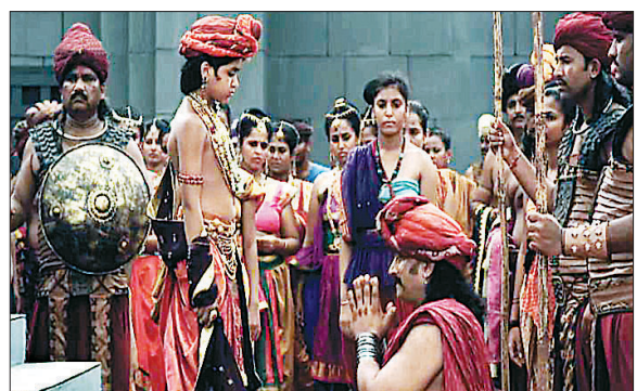
누명을 쓴 고리를 의심하지 않고 진실은 언젠가는 드러날 것이라고 말하는 시타르타