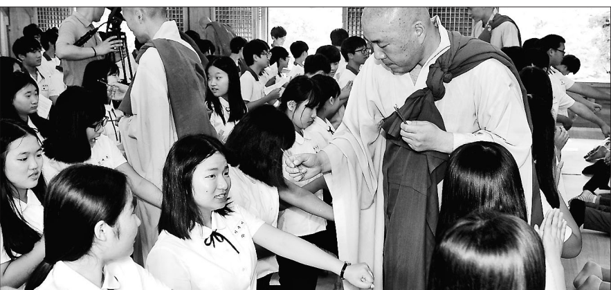
백양사 전계사 스님들이 학생들에게 오계를 내리는 연비를 하고 있다.