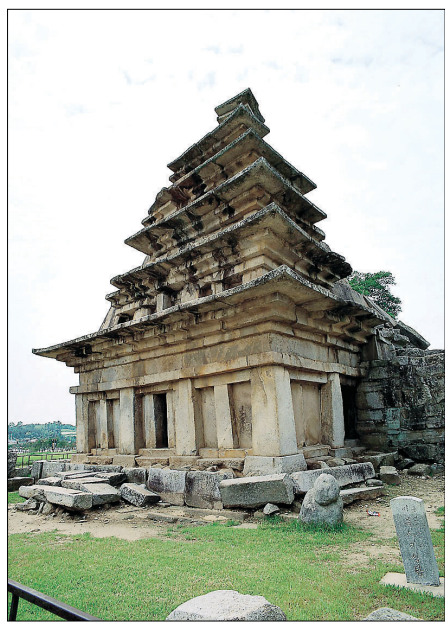
2017년 복원 완료 예정인 익산 미륵사지 동탑

박정주 충남도 문화체육관광국장은 “유네스코가 ‘적정한 관광객’을 강조하는 것은 오히려 관광객 수익을 통한 보존의 원할함