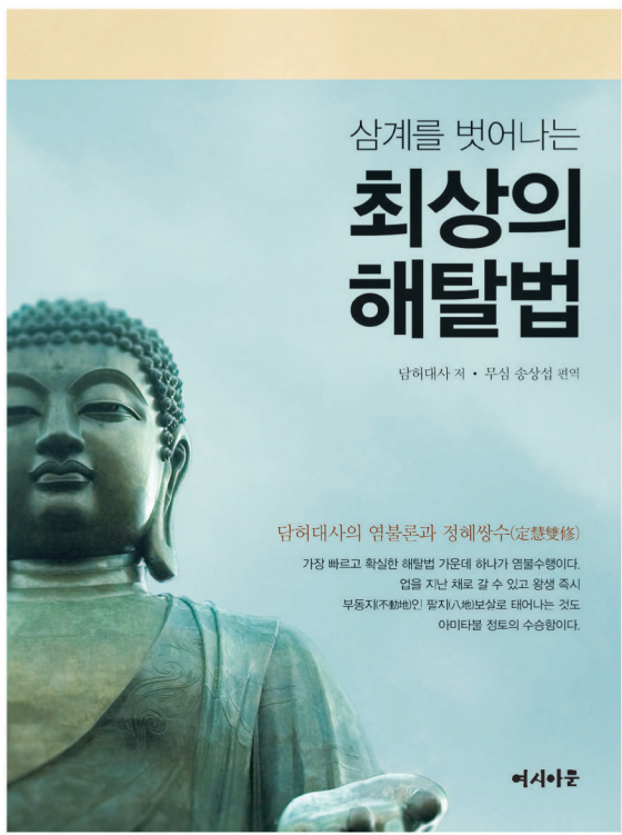
담허대사 저 / 송상섭 번역(아시아문) 232쪽 | 1만 2,000원

우리의 의식 즉 한 생각 속에는 열 가지 법계(十法界)가 구축하다. 즉 온 우주가 통으로 우리 마음 안에 모두 잠겨 있다. 이른바 심세고금(十世古今, 영원한 시간)이 이 한 생각(우리의 의식)을 여의지 않았으며 티끌과 같은 찰토(刹土, 온 세계)가 티끌만큼도 막히지 않았다. 다시 말하면 영겁의 시간과 무한한 공간이 우리의 현재 갖고 있는 이 의식 안에 고스란히 다 숨어있다는 말씀이다.