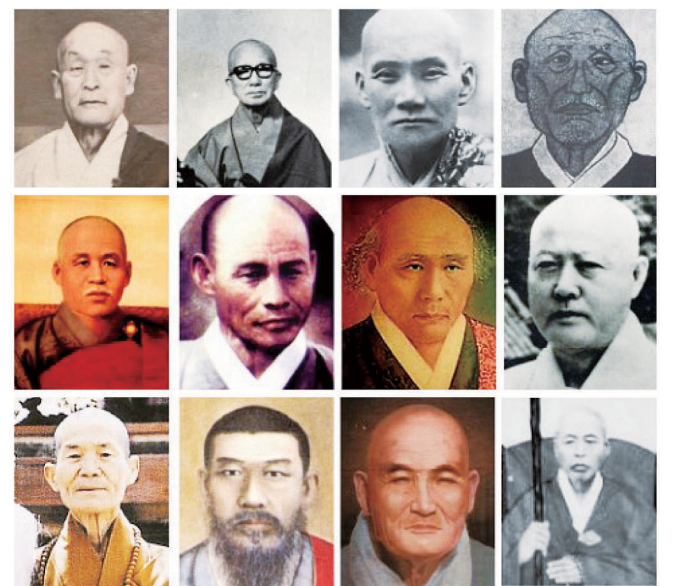
(맨윗줄 왼쪽부터) 효봉 해암 학연 스님, (둘째줄) 용성 만해 만공 동산 스님, (셋째줄) 고암 경허 경봉 민암 스님. 모두가 근현대 한국불교를 풍미했던 선사들이다.

염화시종의 미소만 미소라. 한국 근·현대의 불교를 이끌었던 선지식도 증생제도를 위해 한 없는 자비의 웃음을 날렸다. 그러한 웃음을 선가(禪家)에서는 ‘황금털사자(金毛獅子)’의 미소라고 일컫는다. ‘황금털사자’란 존재의 모습을 표현하는 인간의 한계를 드러낸 뜻이라. 선사들은 삶 속에서는 물론, 법문에서, 제자 사랑에서 그 미소를 강물처럼 쏟아냈다. 이것이 노래로 우리 나오니 바로 선시(禪詩)가 됐다.