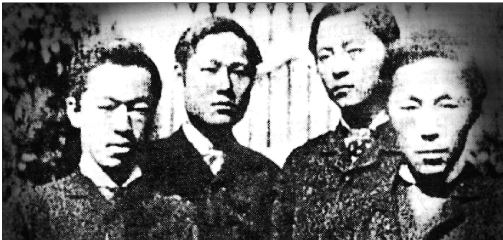
갑신정변 실패 후 일본 망명시절의 박영효, 서광범, 서재필, 김옥균(사진 왼쪽부터). 젊은 신진 세력에 의해 진행된 갑신정변은 청군의 개입으로 3일만에 끝났다. 이를 주도했던 김옥균은 일본 망명 후 당시 상황을 술회한 <갑신일록>을 저술한다. 불교에 심취했던 김옥균의 면모를 살피면 유교적 신분제를 넘어 평등한 세상을 꿈꿨던 근대 지식인의 면모를 알 수 있다. 특히 그 기저에는 불교가 있음이 유추된다.

“조선이 홀로 중국의 속국이 되어 있으니 심히 부끄럽다. 조선이 어느 때에 독립하여 서양의 여러 나라와 같은 대열에 서겠는가.”