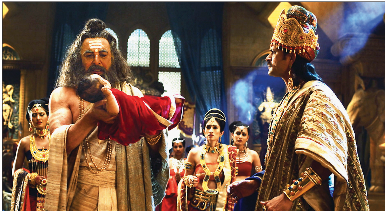
어느날 아시타 성인이 솟도다나 왕 앞에 나타나 “아기는 성인이 될 것”이라고 예언한다. 왕은 이 예언을 부정하고 아들 싯다르타를 전사로 키울 것을 다짐한다.

부처님의 탄생에서 열반까지 재미있는 이야기 속에서 만나는 부처님은 어떤 모습일까? 그리고 우리는 그 속에서 어떤 깨달음을 얻을 수 있을까? '드라마 붓다'를 통해 부처님의 지혜를 만나는 여행을 떠나보자. <편집자주>