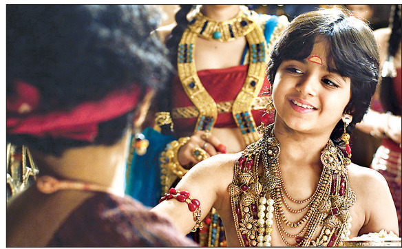
왕자 싯다르타는 연민을 가지고 세상을 바라본다.

마하바라타 전투가 끝난 후에 오랜 세월이 흘렀다. 이 대전투로 인해 인도 땅은 여러 조각으로 분열되었다. 그로부터 다시 2500년이 지났을 무렵 북인도 지방에는 카필라바스투 왕국이 존재했다. 인근에는 마가다 왕국과 바이살리 왕국이 있었다. 카필라바스투는 태양 왕조인 사카족의 후예인 왕, 위대하고도 용감한 솟도다나왕이 다스리고 있었다.