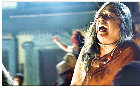
왕은 왕자의 교육을 위해 빈민들을 격리시킨다.