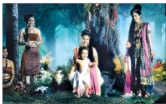
마야 왕비는 아들을 출산한다. 그 이름은 싯다르타.